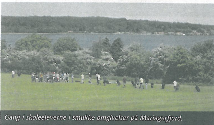
Gang i skoleeleverne i smukke omgivelser på Mariagerfjord.

Mariagerfjord har indledt et samarbejde med en række af kommunens skoler om at lade eleverne stifte bekendtskab med golf. De mange elever cykler ud til banen, hvor de får undervisning af klubbens pro'er og kan spille 9 huls-banen. Der bliver indlagt mange sjove lege og konkurrencer i besøget, og stemningen bliver ind imellem så høj, at det udløser begejstringsbrøl, der næsten kan sammenlignes med et Augusta-roar! Det virker sandsynligt, at mange af dem vil fortsætte i klubben som juniorer.